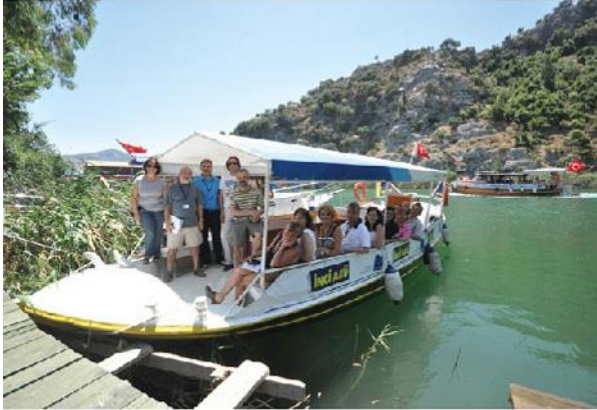
Değerli basın mensuplarıyla birlikte İnci Holding ve İnci Akü YK Üyeleri

Gezi tekneleri bölge halkının en önemli geçim kaynaklarından. Yaz aylarında 400'ün üstünde dizel motorlu gezi teknesi her gün sefere çıkıyor. Teknelerin neredeyse tümü "çıkma motor" tabir edilen ikinci el kamyon motorlarıyla çalışıyor. Motorlar eski ve bakımsız. Periyodik bakımları çok iyi yapılamıyor.