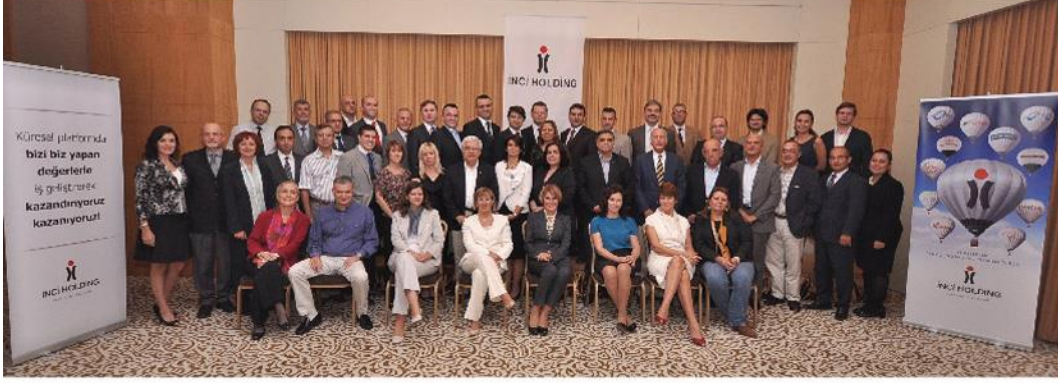
Değerli Unida ekibiyle birlikte Inci Holding Sinerji Grubu

Inci Holding 2012'de 30. yılını kutlamaya hazırlanıyor. Holding'in geleceğini ve 30. yıl kutlamalarını görüşmek üzere Sinerji Grubu üyeleri İzmir Crown Plaza'da bir araya geldi. 3 Ekim'de yapılan ve Unida moderatörlüğünde gerçekleşen toplantı iki oturum olarak gerçekleşti.