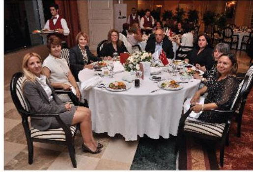
Kokteyl ile başlayan toplantı yemek ile sona erdi