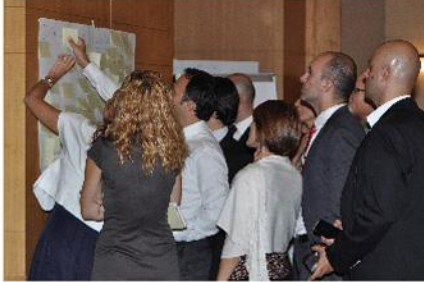
Dört takıma ayrılan work-shop'da katılımcılar belirli konu başlıklarında önerilerini post-it'lere yazarak paylaştı.

girmiş olduğumuzu belirtti. Zaim şöyle devam etti, "Şirketlerimizi 3. kuşaklara devrettiğimizde bunu başaran on aileden birisi olmuş olacağız. Kurucumuzdan devraldığımız görevi ve sorumluluğu gelecek kuşaklara ve çalışanlarımıza devretmeyi amaçlıyoruz.