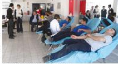
İnci Akü çalışanları Kızılay'a kan bağışında bulundu.