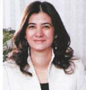
İnci Holding, yönetimi 1974 yılında İnci'de ilk kez üçüncü kuşaktan başkan çıktı.

İnci'de ilk kez üçüncü kuşaktan başkan çıktı. Proje, Manisa OSB ve İnci Lojistik'in ortaklaşa hayata geçirdiği Türkiye-Arıp Deniz Otobanı Manisa'yı İtalya'ya bağladı. Proje, Manisa OSB ve İnci Lojistik'in ortaklaşa hayata geçirdiği Türkiye-Arıp Deniz Otobanı Manisa'yı İtalya'ya bağladı. Proje, Manisa OSB ve İnci Lojistik'in ortaklaşa hayata geçirdiği Türkiye-Arıp Deniz Otobanı Manisa'yı İtalya'ya bağladı.