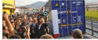
Binali Yıldırım'ın hazretleri şerefini vermesinin ardından Denizotobanı hizmetine başlayacak ilk tren sefere uğurlanıyor

İnci Lojistik Türkiye ve Almanya'da yürüttüğü lojistik operasyonları ile müşterilerine maliyet avantajı sağlayarak sürdürülebilir çözümlerin başında gelen İntermodal servisine bu yıl içerisinde, İzmir limanına ilave olarak Gebze Limanı'nı da ekleyerek servis kapsamını genişletmeyi hedeflemektedir.